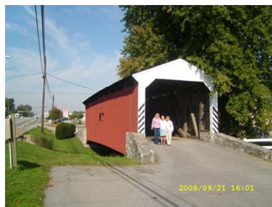
En överbyggd bro