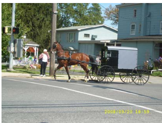
En Amish ute och finåker

Det var inte bara krigiska museer vi besökte vi var också till Amish Country i Pennsylvania. Amishfolket lever som bekant som på 1800-talet. Ingen elektricitet, inga telefoner, inga bilar och traktorer. Deras gårdar är rena mönstergårdar med många hästar och mulor. Där träffade vi också på överbyggda broar. De finns inte bara i Madison County.