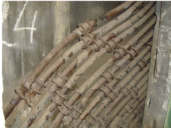
Synlig del av rörpostsystemet