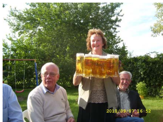
Vi serveras öl på Vogeltränke

I två leasade bilar for vi söderut till Zossen – Wünsdorf, där vi inkvarterades i Gasthaus Vogelsang, ett litet värdshus, där vi var i stort de enda gästerna. Där började vi med en stor stark, sedan middag på zur Vogeltränke och