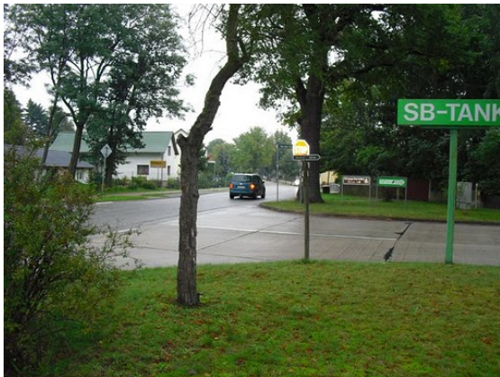
Byn Halbe, där det låg över 40 000 döda i högar

Efter denna genomgång städade vi ur rummen och satte oss i bilarna för att åka till Halbe, som låg ett par mil öster om vår förläggning på andra sidan motorvägen mellan Berlin och Dresden. Där fick vi en genomgång av vilken fruktansvärd slaktplats detta varit bara några dagar före krigsslutet. Nionde armén hade blivit omringad av ryssarna och försökte här göra en utbrytning mot väst. Över 40 000 döda låg i travar på marken. Det var omväxlande civila flyktingar, tyska och ryska soldater. I närheten finns en krigskyrkogård med gravstenar, på vilka det på de flesta står Unbekannt. Det hittas fortfarande likrester i skogarna som begravs på krigskyrkogården. Makabert.