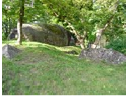
Sprängt torn inne i ett civilt bostadsområde