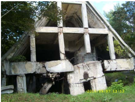
Sprängd stabsbyggnad i Mybach 1

I området fick vi se några märkvärdiga betongtorn, som såg ut som raketer. Dessa var skyddsrum som börjat byggas redan 1936. Redan då visste tydligen Hitler vad som komma skulle. I området Zossen – Wünsdorf byggdes totalt 19 torn, avsedda för de civilanställda i militärkomplexet. Av dessa har hittills 12 sprängts och de resterande sju ska bevaras för utställnings- och andra ändamål. Tornen var 25 m höga och inredda i nio våningar. På kvällen var det som kvällen innan. Öl, middag och genomgång av övningsledaren vad som väntade oss nästa dag.