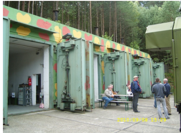
Östtyskt atomsäkert mobförråd