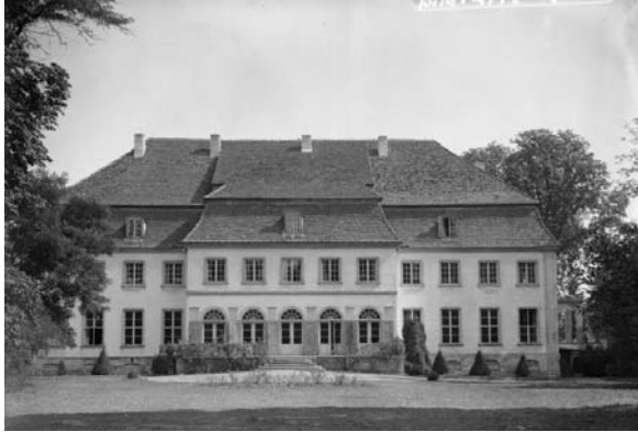
Slottet i Harnekop. F d general Berlins stab