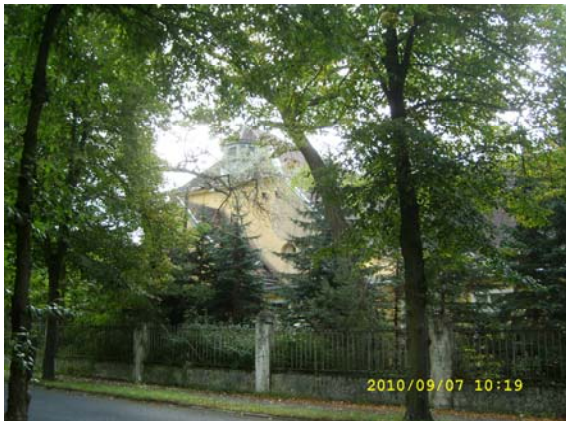
F d tyska pansarskolan, sedan Sovjets högkvarter