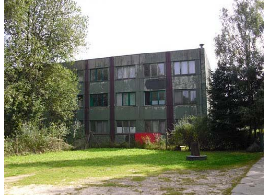
F d östtysk stabsbyggnad

Ännu en anläggning stod på agendan. Den låg en knapp mil från Harnekop, och var en del av Warszawapaktens strategiska ledningsplatser. Denna var en modern radiolänkanläggning med troposcatterförbindelser till Rostock och Dresden och sedan vidare över hela Östeuropa. Anläggningen hade givetvis varit mycket hemlig och omgiven av ett 10kV elstängsel. Den hade kostat många miljoner, men kom endast att vara i drift i tre månader. Sedan upphörde WP och Östtyskland. Därefter hade allt rivits ut och skingrats. Anläggningen hade sedan övertagits från Bundeswehr av ett gäng idealister, lik oss, som återuppbyggt allt som tidigare och även fått det att fungera. Heder åt sådana grabbar. Vi kom överens om att försöka ha ett utbyte med dem. De skänkte oss en östtysk fälttelefon som minne.