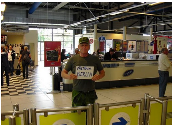
Övningsledaren tar emot på Berlin-Schönefeld