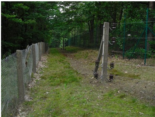
10 kV stängslet runt anläggningen

Ännu en anläggning stod på agendan. Den låg en knapp mil från Harnekop, och var en del av Warszawapaktens strategiska ledningsplatser. Denna var en modern radiolänkanläggning med troposcatterförbindelser till Rostock och Dresden och sedan vidare över hela Östeuropa. Anläggningen hade givetvis varit mycket hemlig och omgiven av ett 10kV elstängsel. Den hade kostat många miljoner, men kom endast att vara i drift i tre månader. Sedan upphörde WP och Östtyskland. Därefter hade allt rivits ut och skingrats. Anläggningen hade sedan övertagits från Bundeswehr av ett gäng idealister, lik oss, som återuppbyggt allt som tidigare och även fått det att fungera. Heder åt sådana grabbar. Vi kom överens om att försöka ha ett utbyte med dem. De skänkte oss en östtysk fälttelefon som minne.