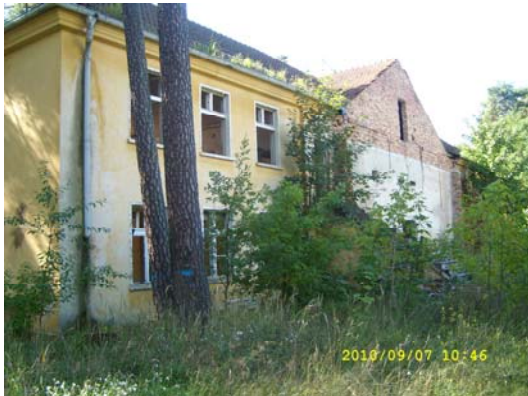
Övergiven tysk kasern

Nästa dag for vi i ottan till Zossen – Wünsdorf. Det var en jätteanläggning en g-platsernas gpl. Området var indelat i fem sk militärstäder med massvis av kaserner. Många var tyska, många sovjetiska. De flesta var öde, men ett flertal var ombyggda till civila bostäder.