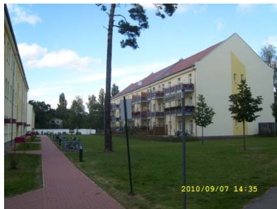
Kasern ändrad till bostäder

Själva OKH var 12 stora betongbyggnader maskerade som civila bostadshus. Detta område benämndes Maybach 1. Där tjänstgjorde 3796 stabsmedlemmar, 739 vaktpersonal och 748 betjäningsspersonal. Byggnaderna var nu sprängda. Vår ciceron pekade ut i vilka hus planeringen för invasionen i Polen, Frankrike och Ryssland hade genomförts. Dessa byggnader hade även en våning under jord och förbindelse med sambandsbunkern kallad Zeppelin. Denna bunker var i tre våningar under jord. Den var inte nedsprängd i urberget som i Sverige, utan nedgrävd och gjuten i metertjock betong. Nedgångarna till bunkern var camouflerade som civila bostäder. Amerikanerna hade försökt bomba anläggningen, men den enda skada de gjorde var att ödelägga ett barackläger för vad vi kallar sambandslottor. Ryssarna hade efter kriget fyllt denna väldiga anläggning med vatten efter att först plockat bort allt av värde. Då Kalla kriget blev som hetast pumpades vattnet bort och anpassades av ryssarna till krigsstab. Ryssarna hade också byggt en ny anläggning för 16.flygarméns stab.