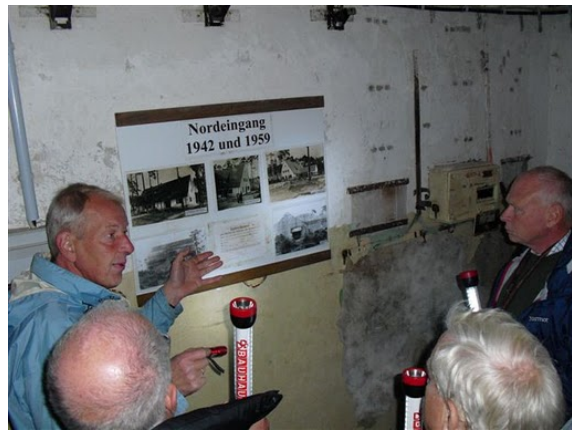
Vår ciceron visar hur nedgångarna maskerades